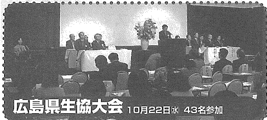
広島県生協大会 10月22日水 43名参加

美しい身を守る基金活動 リサイクルバザー 総額 36,940円 ご協力ありがとうございます