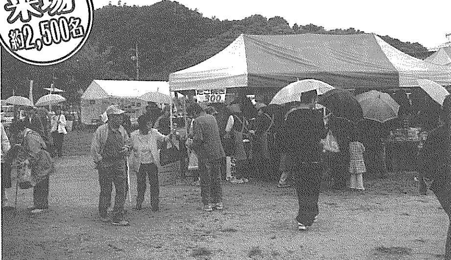
▲楽しめる組合員・市民で賑わう各店舗模擬店

今年も因島漁業協同組合の共催、J A 尾道市協賛、しまなみ日曜市、生協ひろしまハウジング出店で、協同組合まつりが開催されました。当日は悪天候にもかかわらず、多くの組合員・市民で賑わいました。 家庭会の皆さんの協力で、模擬店は昨年以上の供給高を上げた店舗もあり、忙しさの中にも笑顔と楽しい声が響きました。特に青果コーナーは長蛇の列ができました。