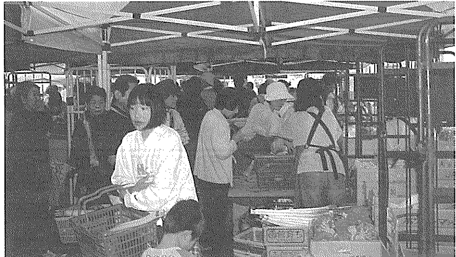
▲組合員で賑わう青果コーナー