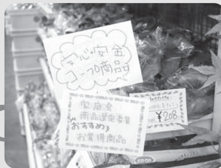
▲手書きポップが好評な生名店