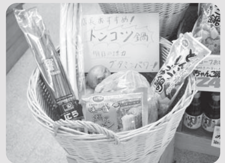
▲店長お勧め鍋展示が好評な重井店